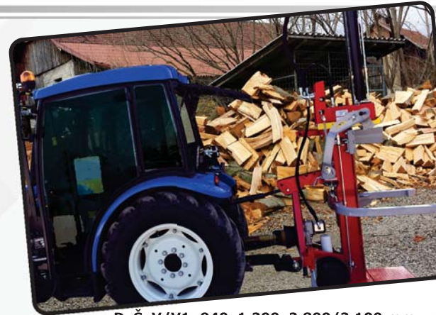
DxŠxV/V1: 940x1.200x2.800/2.100 mm