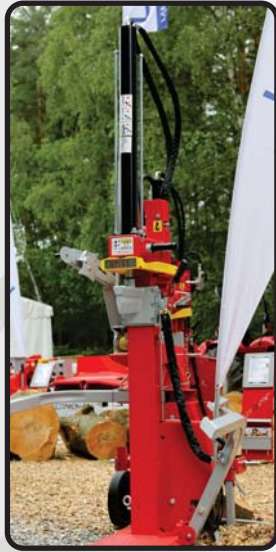
NASTAVITEV IZKLOPA SEKIRE ZGORAJ IN SPODAJ