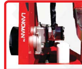
PUMPE GR2 C